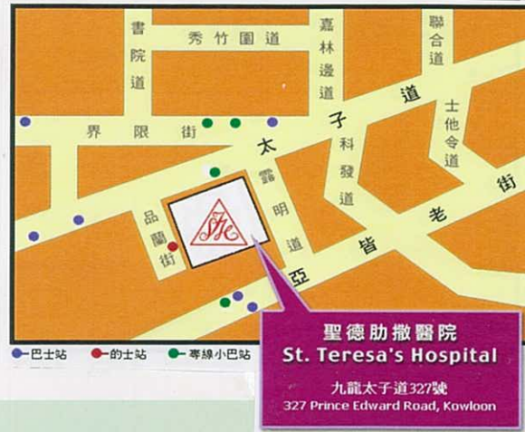
聖德肋撒醫院 掃描部

我們會根據病人所需的檢查部位、病歷及主診醫生之要求，來決定病人是否需要注射靜脈造影劑以獲取更多資料用以斷症。當然，我們會先得到主診醫生及病人的同意，才會為病人進行注射造影劑。