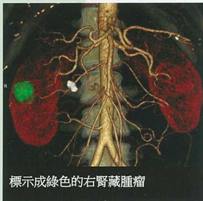
標示成綠色的右腎藏腫瘤